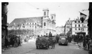
© Musée de la résistance et de la déportation