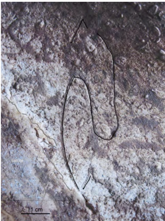
Cheval gravé sur la voûte

La grotte des Gorges se trouve à quelques kilomètres de la ville de Dole, sur le territoire de la commune d'Amange (Jura). C'est un site du Paléolithique supérieur ancien, dont les couches archéologiques sont attribuables, à l'Aurignacien. L'âge est d'environ 35000-34000 ans pour les plus anciennes, et 30000-29000 ans pour les plus récentes. Le site apporte de précieuses informations sur la culture aurignacienne et l'environnement au Paléolithique supérieur ancien en milieu continental. Cependant, la présence de gravures sur la voûte et sur de nombreux blocs calcaires, ainsi qu'une tête d'ours sculptée, donnent à la grotte des Gorges une dimension particulière. C'est le premier site d'art du Paléolithique supérieur ancien découvert dans l'est de la France, et le seul site européen d'âge comparable où sont associées trois formes d'art. Son ancienneté laisse supposer qu'il a pu jouer un rôle important dans la diffusion des thèmes et des symboles artistiques pendant cette période du Paléolithique.