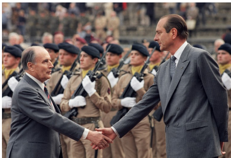
François Mitterrand, président de la République de gauche, serrant la main au Premier ministre de droite Jacques Chirac

Au soir du 16 mars 1986, la coalition RPR-UDF-Divers droite, avec 43.9 % des suffrages exprimés, obtient de justesse la majorité absolue en sièges lors des élections législatives. Avec 31 % des voix recueillies, le Parti socialiste ne connaît pas pour autant un désaveu. François Mitterrand, élu pour sept ans président de la République en 1981, refuse de démissionner.