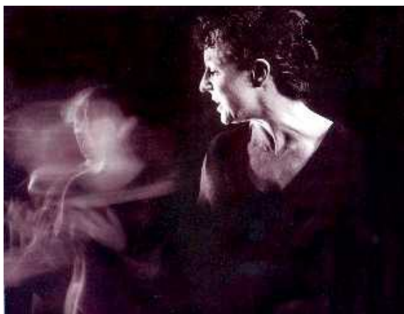
© Compagnie Le Porte Plume / Sylvie Malissard

➤ Travail sur un corpus de textes littéraires, juridiques et historiques sur le sujet