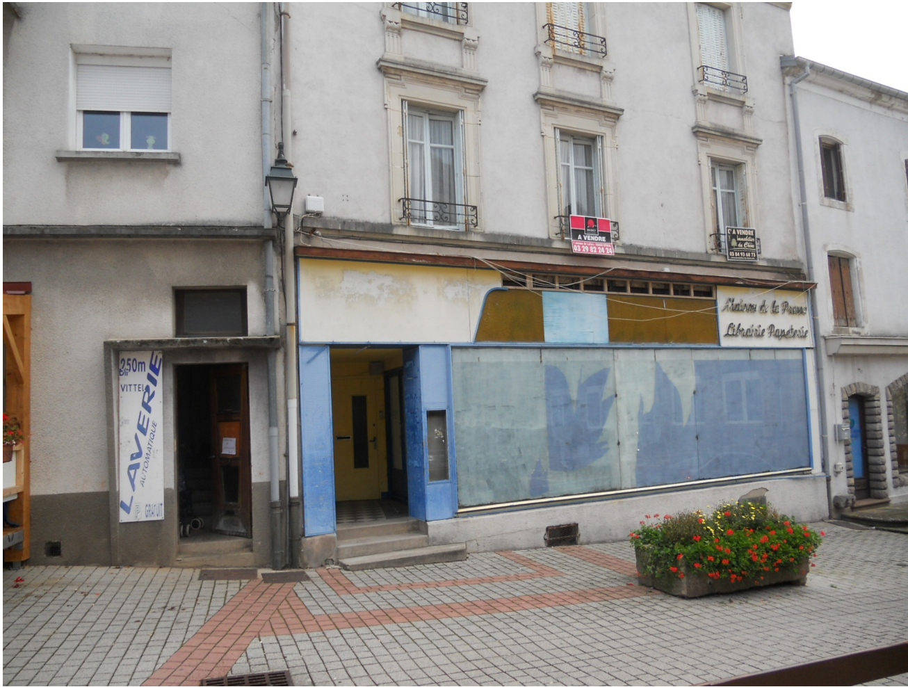
Octobre 2011

Bains les Bains : Un bourg rural qui survit avec le thermalisme , mais dont les commerces ferment