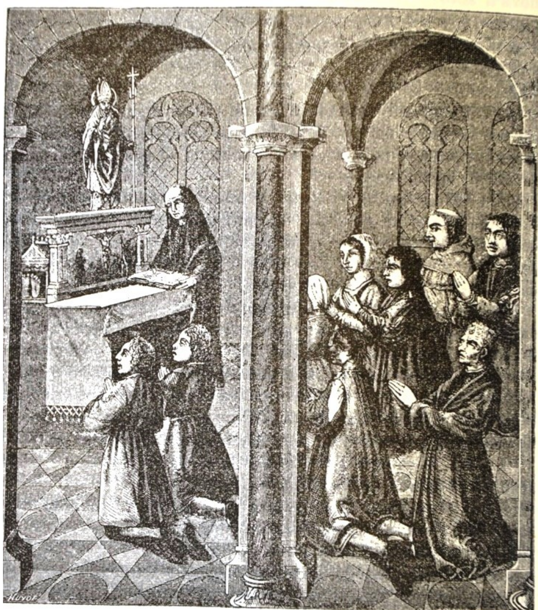
Fig. 165. Les pèlerins visitant saint Claude dans sa chapelle. (D'après un tableau du XV e siècle.)

« Saint-Claude » par D.P. BENOIT, Montreuil sur Mer, Imprimerie de la Chartreuse de notre Dame des Prés