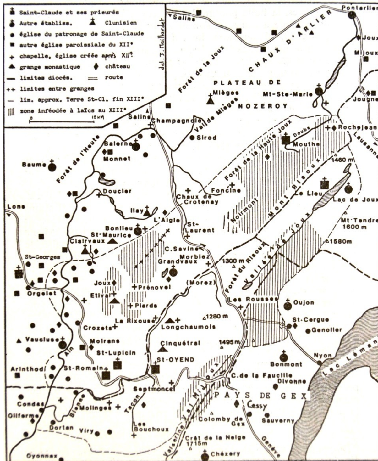
La terre de Saint-Claude aux XII e et XIII e siècles