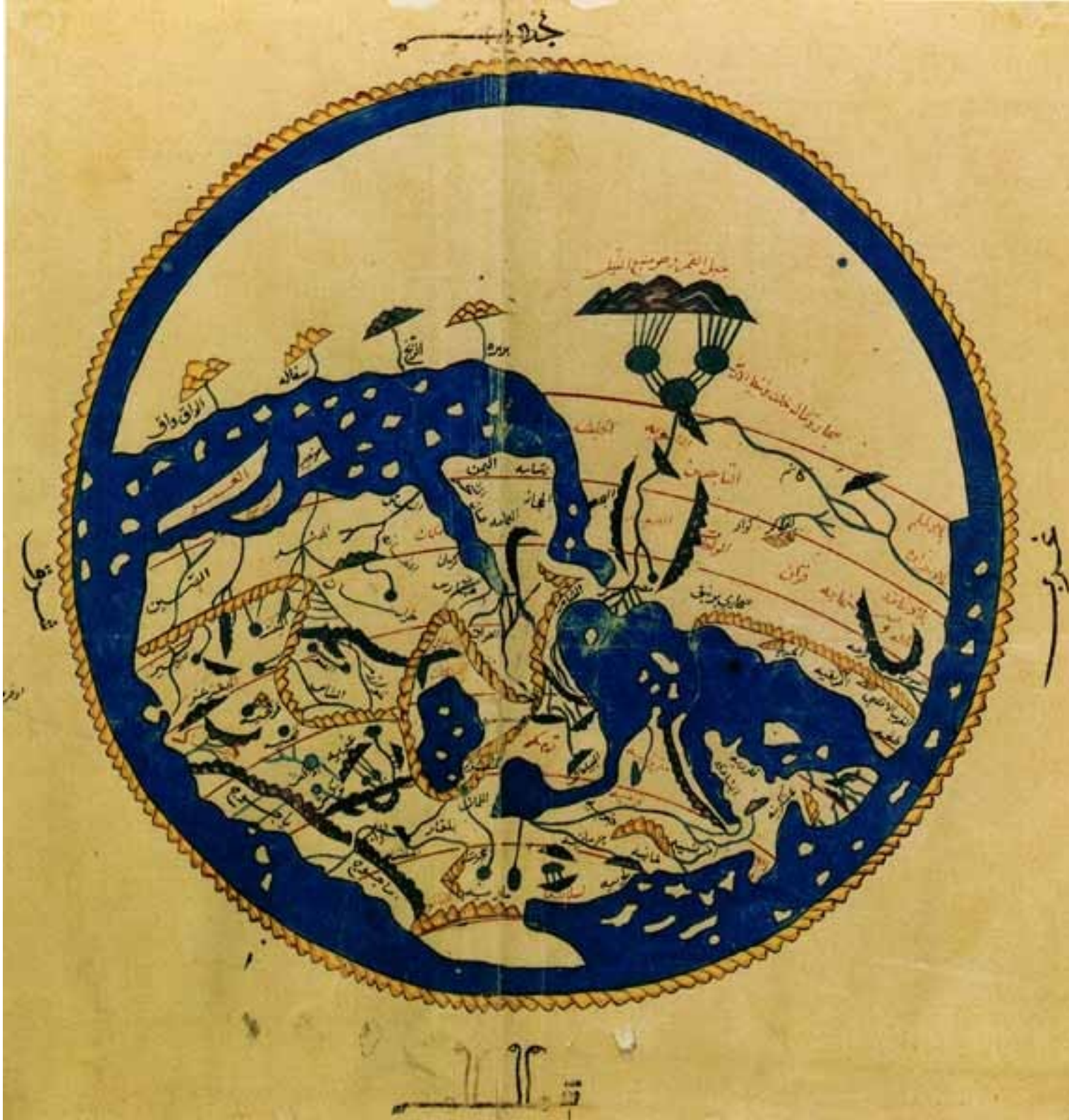
Carte Al Idrisi Manuscrit du Caire 1456 Conservée à La Boldeian Library d'Oxford

Ressemblances et différences avec carte de Ptolémée et carte du T en O ?