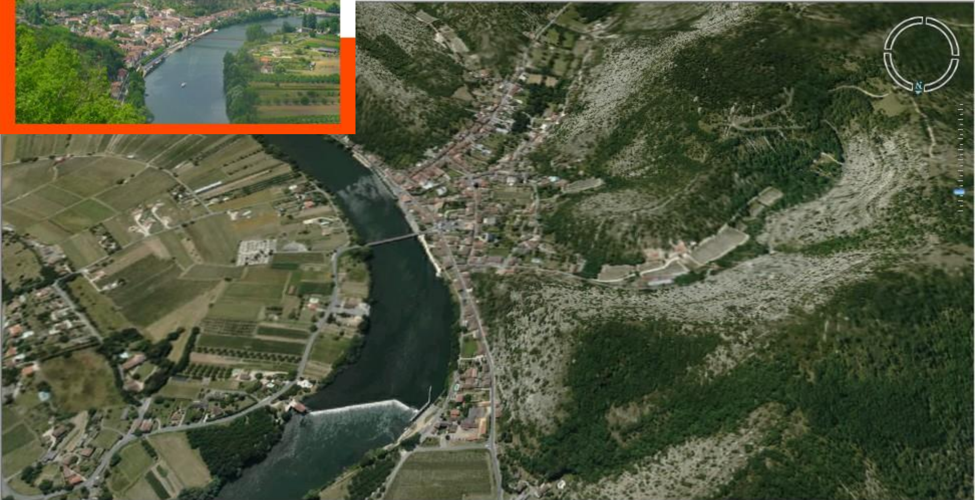
Image extraite du Géoportail.