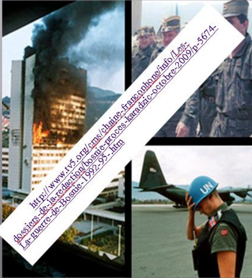
La Bosnie de l'accord de Dayton (1995)

http://cartographie.sciences-po.fr/fr/balkans-bosnie-accords-de-dayton-1995